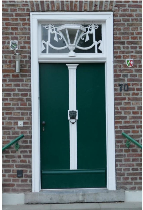
Gefertigt nach altem Vorbild mit unterschiedlichsten Verzierungen und Profilen