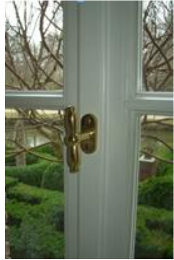
Griffsitz mittig auf der Schlagleiste in klassischer Form mit moderner Technik oder historisch